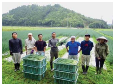
<独立支援研修生制度の仲間>

2013年から「独立支援研修生制度」を設け、新規就農・農業で独立したい若手を全国から募っています。京野菜・九条ねぎの伝統を守っていく担い手、京都府外でも活躍できる人財を育成しています。独立後生産した一定品質を満たした九条ねぎを全量買い上げるなど農地、機械、肥料、販路について多くのサポートをしています。