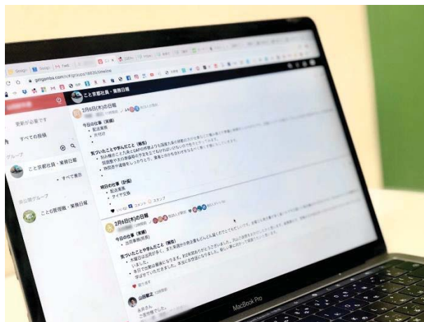
<日報「gamba!(ガンバ)」を入力している様子>