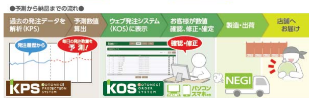
<受発注システムのイメージ>