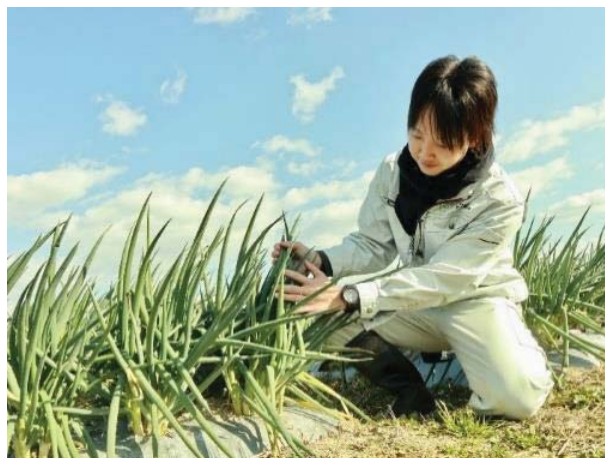
<ほ場で作業している社員の様子>

しかし、会社が成長するにつれて農業部門の割合が低下し、 他部門で働く社員との公平性 の観点からも、農業部門だけ別の取扱いをするのが実態と合わなくなってきました。また、 農業部門の社員のモチベーションアップ のために、社会保険労務士と相談して、今の割増賃金制の一本化の形を整えることができました。