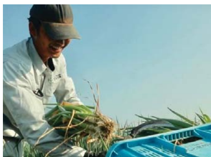
<九条ネギの収穫作業の様子>

自己研鑽に対して補助しており、社内で担当している業務との関連度合いに応じて、全額補助、半分補助、3分の1補助と補助率を変えており、仕事に関係ない習い事でも個人の能力向上の一環として補助を受けることができます。